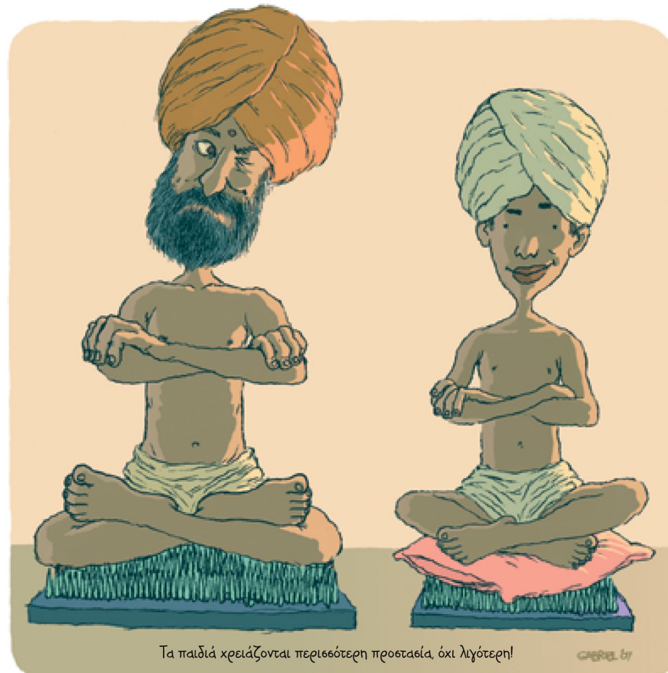
Τα παιδιά χρειάζονται περισσότερη προστασία, όχι λιγότερη!

Τα παιδιά που ανήκουν σε εθνικές, γλωσσικές ή θρησκευτικές μειονότητες, έχουν δικαίωμα να έχουν τη δική τους πολιτιστική ζωή, να χρησιμοποιούν τη γλώσσα τους και να ασκούν τη θρησκεία τους.