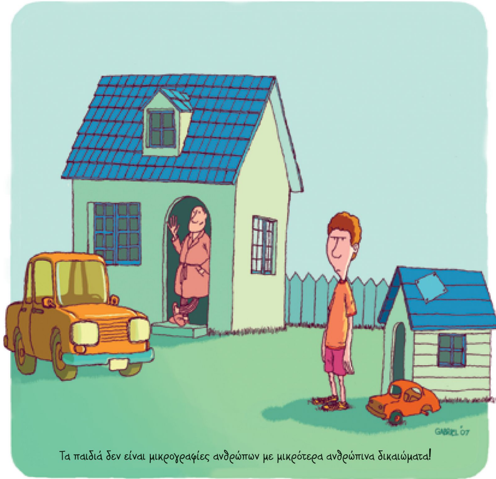
Τα παιδιά δεν είναι μικρογραφίες ανθρώπων με μικρότερα ανθρώπινα δικαιώματα!