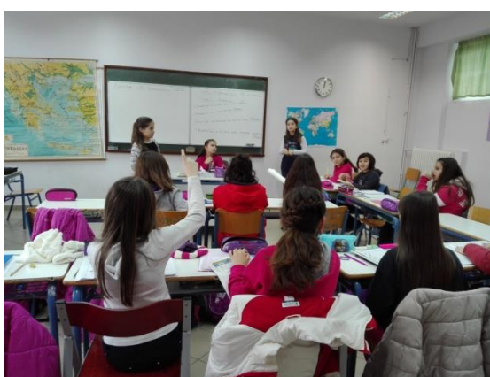
Εικόνες από συμβούλιο σε τάξη δημοτικού σχολείου